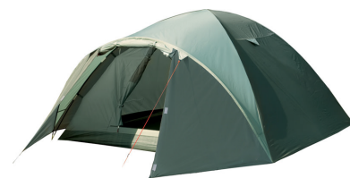
DENVER AIR 4